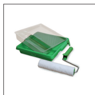
Osmo Mikrofiber roller