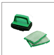
Osmo Spardyna filt och hållare