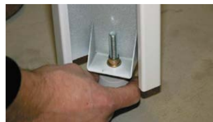
3. Justera fötterna så att stativet står i våg. Nu är stativet klart för inmontering av badkar.