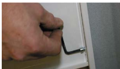
2. Efterdra insexskruvarna för att stabilisera stativet