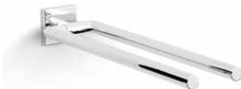
S-line handduksstång, dubbel