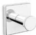
S-line enkelkrok i krom