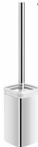
S-line WC-borste med fristående hållare i krom och frostat glas