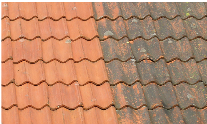
Tak av tegelpannor med angrepp av alger och lav. Två år efter behandling med Grön-Fri. Inget efterarbete.