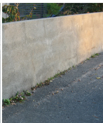
Putsad mur med angrepp av lav behandlad med Grön-Fri. Inget efterarbete. Vänster: Innan behandling. Höger: Fyra år efter behandling.