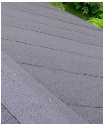
Tak av papp med angrepp av lav. Tre år efter behandling med Grön-Fri. Inget efterarbete.