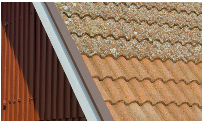
Tak av betongpannor med angrepp av lav. Två år efter behandling med Grön-Fri. Inget efterarbete.