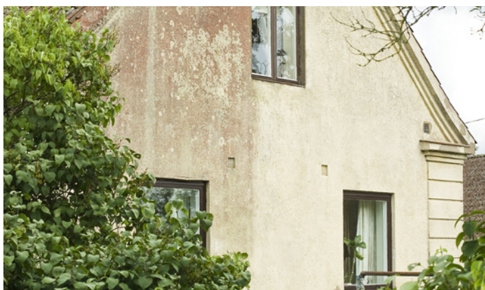
Putsad fasad med angrepp av rödalger. Fyra månader efter behandling med Grön-Fri. Inget efterarbete.