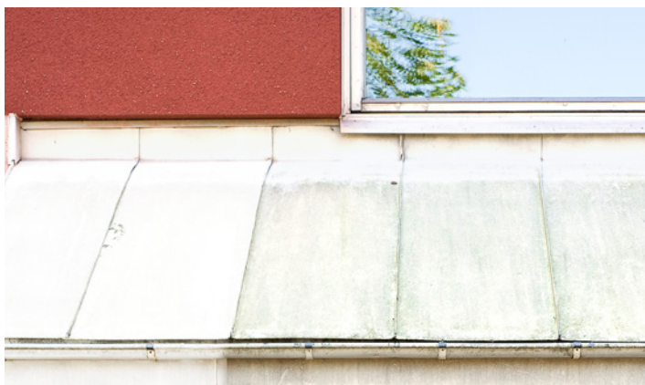
Plåttak med angrepp av alger. Ett år efter behandling med Grön-Fri. Inget efterarbete.